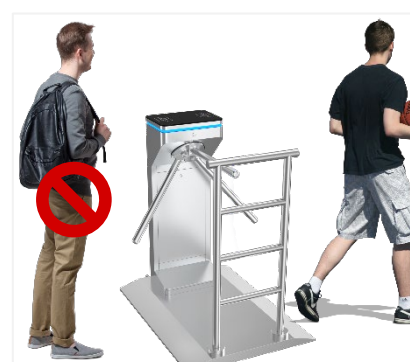
Biztonságos: egy nyitásra csak egy személy léphet be.